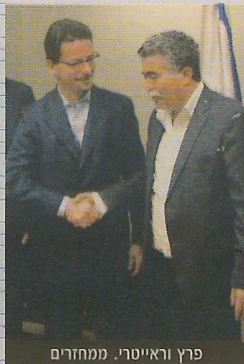
פרץ וראיטרי. ממחזרים