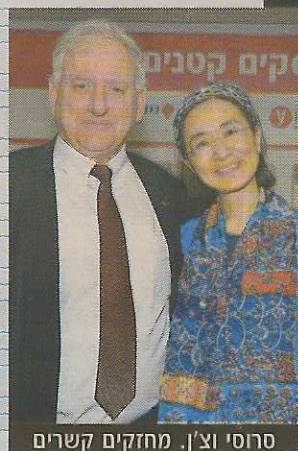
סחסי וצ'ן. מחזקים קשרים